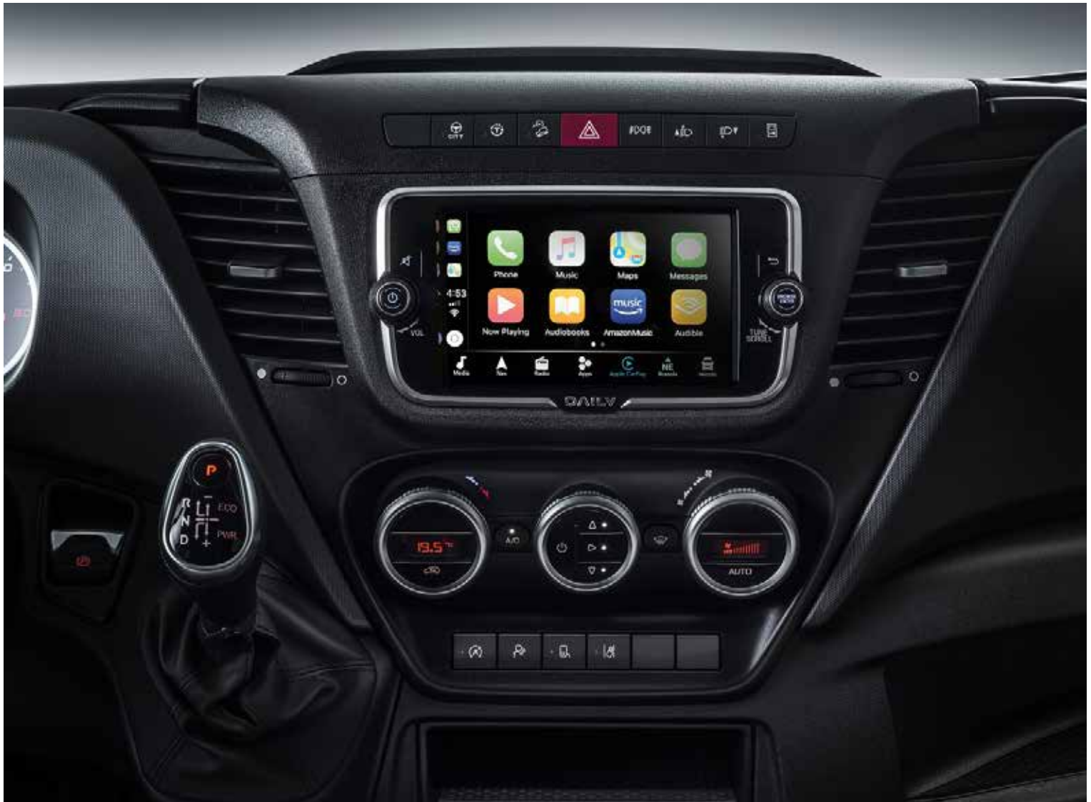
מולטימדיה מקורית בעברית עם מסך 7 אינץ' הכוללת שיקוף של הטלפון ומצלמת נסיעה לאחור