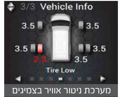
מערכת ניטור אוויר בצמיגים