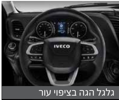
גלגל הגה בציפוי עור