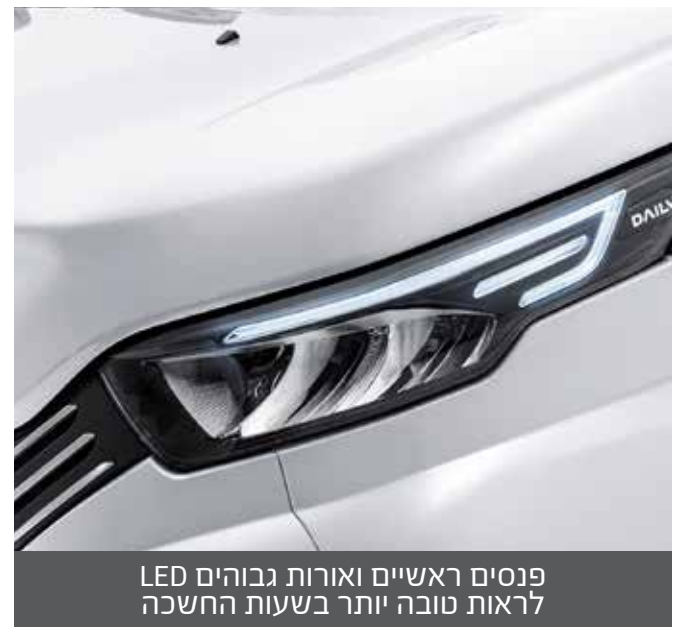
פנסים ראשיים ואורות גבוהים LED לראות טובה יותר בשעות החשכה