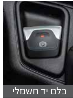
בלם יד חשמלי