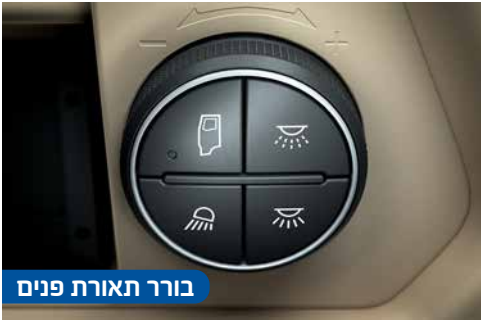
בורר תאורת פנים