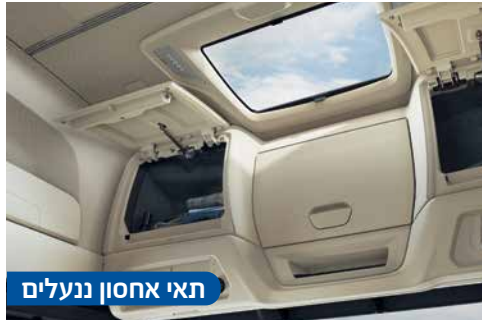
תאי אחסון ננעלים