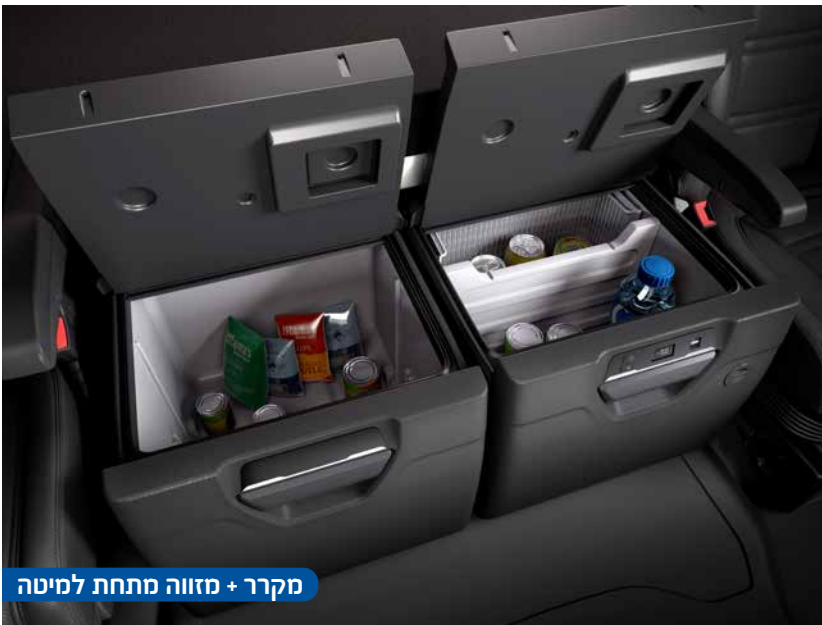
מקרר + מזווה מתחת למיטה