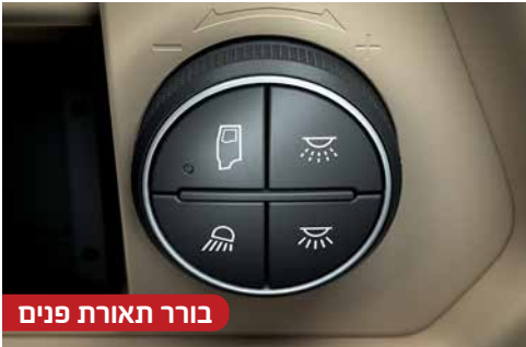
בורר תאורת פנים