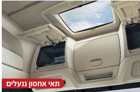
תאי אחסון ננעלים