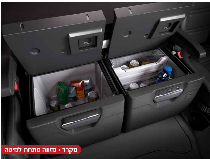
מקרר + מזווה מתחת למיטה