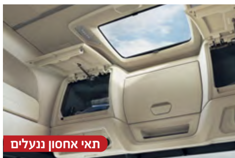
תאי אחסון ננעלים