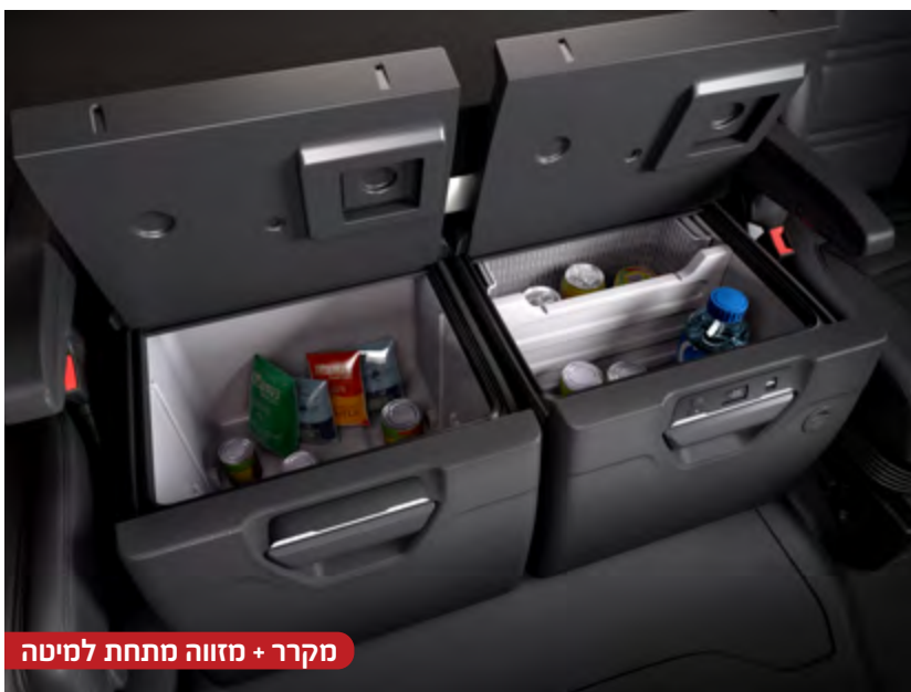
מקרר + מזווה מתחת למיטה