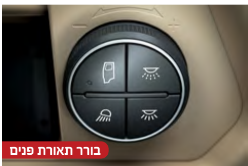
בורר תאורת פנים